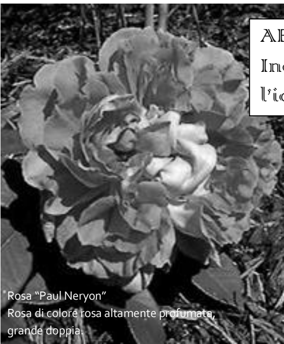
Rosa "Paul Neryon" Rosa di colore rosa altamente profumata, grande doppia.

ABBANDONO PERFETTO Indispensabile condizione per l'identificazione. (Mère)